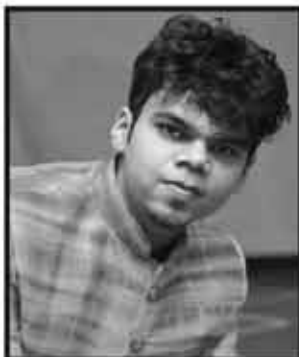
ચિ. લુકાશ વસનજી છાડવા

આપણા છાડવા કુળની રક્ષા કરનાર કુળદેવી મહામાયા શ્રી મોમાય માતાજીની પહેડી (સ્નેહમીલન) સ્થાનિકે સુવર્ણ મુકામે સોમવાર તા. ૪-૯-૨૦૧૭ ના શુભ દિને યોજવામાં આવશે. આ પહેડી યોજવાનો અમુલ્ય લાભ અમારા પરિવારને મળતા અમો ખુબજ હર્ષની લાગણી અનુભવીએ છીએ. તો આપ સૌને પણ શ્રી મોમાય માતાજીના દર્શન, મહાપ્રસાદ અને મહાઆરતી, રાસ-ગરબાનો લાભ લેવા અમારી સ્નેહભરી વિનંતી સાથે ભાવભર્યું આમંત્રણ.